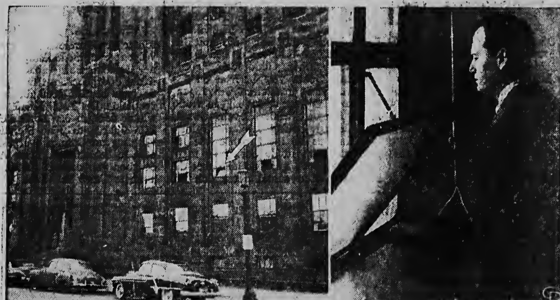
Dr. SAM SHEPPARD, e dokter di Cleveland na Merka, cu ta sospecha di a mata su esposa kende tabata spera un baby, a ser juzga pa jurado y juez a pidi „serra pa bida largu“ pe. Mientrastando a presenta algun punta culpica y abogadonan di Sheppard a pidi un investigación de e caso atrobe. Na man drechi nos ta welta Sheppard mirando for di un bentana di e cuarto di corte di justicia. E flecha ta muestra e lugar caminda nan a haya su esposa morto.